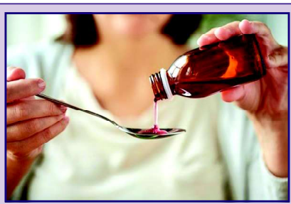
ਜਾਂਚ ਵਿੱਚ ਪਤਾ ਲੱਗਾ ਹੈ ਕਿ ਸਿਰਪ ਵਿੱਚ ਡਾਇਇਬੀਲੀਨ ਗਲਾਇਕੋਲ ਦੀ ਵਧੇਰੇ ਮਾਤਰਾ (46.28%) ਮੌਜੂਦ ਹੈ, ਜੋ ਇੱਕ ਜ਼ਹਿਰੀਲਾ ਰਸਾਇਣਕ ਹੈ ਅਤੇ ਸਿਹਤ ਲਈ ਘਾਤਕ ਹੈ।...ਬੱਚੇ ਸਿਰਪ ਪੀਣ ਤੋਂ ਬਾਅਦ ਤੇਜ਼ ਬੁਖਾਰ, ਉਲਟੀਆਂ ਤੇ ਗੁਰਦੇ ਦੀ ਖਰਾਬੀ ਜਿਹੀਆਂ ਸਮੱਸਿਆਵਾਂ ਨਾਲ ਪੀੜਤ ਹੋ ਗਏ ਅਤੇ ਅੰਤ ਮੌਤ ਦੇ ਮੂੰਹ ਵਿੱਚ ਜਾ ਪਏ।

ਰਾਜਸਥਾਨ ਦੇ ਡਾਕਟਰਾਂ ਨੂੰ ਨਿਰਦੇਸ਼ ਦਿੱਤੇ ਗਏ ਹਨ ਕਿ ਉਹ ਕਿਸੇ ਵੀ ਅਜਿਹੀ ਦਵਾ ਨੂੰ ਨਾ ਵਰਤਣ। ਇਹ ਸਮੱਸਿਆ ਸਿਰਫ਼ ਇੱਕ ਸੂਬੇ ਤੱਕ ਸੀਮਿਤ ਨਹੀਂ ਹੈ। ਭਾਰਤ ਵਿੱਚ 2025 ਵਿੱਚ ਪ੍ਰਦੂਸ਼ਿਤ ਕਫ਼ ਸਿਰਪਾਂ ਨਾਲ ਜੁੜੀਆਂ ਘਟਨਾਵਾਂ ਵਧ ਰਹੀਆਂ ਹਨ। ਕੇਂਦਰੀ ਸਿਹਤ ਮੰਤਰਾਲਾ ਨੇ ਰਾਜਸਥਾਨ ਅਤੇ ਮੱਧ ਪ੍ਰਦੇਸ਼ ਵਿੱਚ 18 ਬੱਚਿਆਂ ਦੀਆਂ ਮੌਤਾਂ ਤੋਂ ਬਾਅਦ ਉੱਚ-ਪੱਧਰੀ ਮੀਟਿੰਗ ਕੀਤੀ ਅਤੇ ਸਾਰੇ ਰਾਜਾਂ ਨੂੰ ਅਲਰਟ ਜਾਰੀ ਕੀਤਾ। ਤਿੰਨ ਸੂਬਿਆਂ- ਪੰਜਾਬ, ਮੱਧ ਪ੍ਰਦੇਸ਼ ਅਤੇ ਰਾਜਸਥਾਨ ਨੇ ਇਸ ਸਿਰਪ 'ਤੇ ਪਾਬੰਦੀ ਲਗਾ ਦਿੱਤੀ ਹੈ। ਨੈਸ਼ਨਲ ਰਿਉਮਿਨ ਰਾਈਟਸ ਕਮਿਸ਼ਨ (ਐੱਨ.ਐੱਚ.ਆਰ.ਸੀ.) ਨੇ ਮੱਧ ਪ੍ਰਦੇਸ਼, ਰਾਜਸਥਾਨ ਤੇ ਉੱਤਰ ਪ੍ਰਦੇਸ਼ ਨੂੰ ਨੋਟਿਸ ਜਾਰੀ ਕੀਤੇ ਹਨ ਅਤੇ ਕੇਂਦਰੀ ਸਿਹਤ ਮੰਤਰਾਲੇ ਤੋਂ ਵਿਸਥਾਰ ਨਾਲ ਜਾਂਚ ਦੀ ਮੰਗ ਕੀਤੀ ਹੈ।