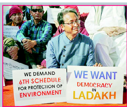
■ ਲੋਹ-ਲੱਦਾਖ ਨੂੰ ਸੰਵਿਧਾਨ ਦੀ ਧਾਰਾ 244 ਦੇ 6ਵੇਂ ਸਭਿਉਲ ਵਿੱਚ ਲਿਆਉਣ ਲਈ ਨਵੀਂ ਦਿੱਲੀ ਦੇ ਜੰਤਰ-ਮੰਤਰ ਵਿੱਚ ਲੱਦਾਖ ਦੇ ਹੋਰ ਪ੍ਰਦਰਸ਼ਨਕਾਰੀਆਂ ਨਾਲ ਇੱਕ ਧਰਨੇ ਵਿੱਚ ਹਿੱਸਾ ਲੈਂਦੇ ਹੋਏ ਸੋਨਮ ਵਾਂਗਚੁੱਕ (ਫਾਈਲ ਫੋਟੋ)

ਕੀਤਾ ਹੈ। ਨਾ ਹੀ ਉੱਤਰ ਪੂਰਬ ਦੇ ਰਾਜਾਂ ਵਾਂਗ ਉਨ੍ਹਾਂ ਨੂੰ ਛੇੜ ਕੇ ਸਭਿਉਲ ਦੇ ਤਹਿਤ ਸੁਰੱਖਿਅਤ ਦਿੱਤਾ ਗਿਆ ਅਤੇ ਨਾ ਹੀ ਲੱਦਾਖ ਨੂੰ ਸਟੇਟ ਦਾ ਦਰਜਾ ਦਿੱਤਾ ਗਿਆ ਹੈ। ਲੱਦਾਖੀ ਲੋਕਾਂ ਦਾ ਮਹਿਬੂਬ ਆਗੂ ਸੋਨਮ ਵਾਂਗਚੁੱਕ ਲੱਦਾਖ ਦੀ ਨਹੀਂ ਸਗੋਂ ਸਾਰੀ ਦੁਨੀਆਂ ਵਿੱਚ ਇੱਕ ਜਾਣੀ-ਪਛਾਣੀ ਸ਼ਖ਼ਸੀਅਤ ਹੈ। ਉਸ ਨੇ ਲੱਦਾਖ ਦੀ ਸਥਾਨਕ ਸੰਸਕ੍ਰਿਤੀ, ਭਾਸ਼ਾ ਅਤੇ ਵਾਤਾਵਰਣ ਨੂੰ ਬਚਾਉਣ ਲਈ ਵੱਡੇ ਯਤਨ ਕੀਤੇ ਹਨ। ਕਈ ਨਵੀਆਂ ਰਵਾਇਤਾਂ (ਇਨੋਵੇਸ਼ਨ) ਤੋਂ ਲੈ ਕੇ, ਜਿਨ੍ਹਾਂ ਨਾਲ ਇਸ ਖੇਤਰ ਦੇ ਲੋਕ ਆਪਣੇ ਗਲੇਸ਼ੀਅਰਾਂ ਨੂੰ ਬਚਾਅ ਸਕਦੇ ਹਨ। ਵਾਂਗਚੁੱਕ ਨੇ ਗਲੇਸ਼ੀਅਰਾਂ ਦੀ ਸੁਰੱਖਿਆ ਲਈ ਬਰਫ ਦੇ ਸਤ੍ਹੇ ਬਣਾਉਣ ਦੀ ਕਾਢ ਕੱਢੀ। ਇਸ ਤੋਂ ਇਲਾਵਾ ਆਪਣੇ ਭੁੱਖ ਹਤਾਲ ਦੇ ਤਜਰਬੇ ਵਿੱਚੋਂ ਸੋਨਮ ਵਾਂਗਚੁੱਕ ਨੇ ਸੋਲਰ ਹੀਟਿੰਗ ਟੈਂਕ ਬਣਾਉਣ ਦਾ ਕਾਰਜ ਵੀ ਇਜ਼ਾਜ਼ ਕੀਤਾ। ਉਨ੍ਹਾਂ ਦੀਆਂ ਇਨ੍ਹਾਂ ਕੋਸ਼ਿਸ਼ਾਂ ਨੂੰ ਸੰਸਾਰ ਪੱਧਰ 'ਤੇ ਬਹੁਤ ਸਾਰੀਆਂ ਯੂਨੀਵਰਸਿਟੀਆਂ ਵੱਲੋਂ ਆਨਰੇਰੀ ਡਿਗਰੀਆਂ ਨਾਲ ਸਨਮਾਨਿਆ ਗਿਆ ਹੈ। ਇਸ ਸੰਬੰਧ ਵਿੱਚ ਗਿਆਨ ਦਾ ਤਬਾਹੀ ਵੀ ਉਨ੍ਹਾਂ ਯੂਨੀਵਰਸਿਟੀਆਂ ਨਾਲ ਕੀਤਾ ਗਿਆ। ਇਨ੍ਹਾਂ ਯਤਨਾਂ ਕਾਰਨ ਉਨ੍ਹਾਂ ਨੂੰ ਹਾਲ ਹੀ ਵਿੱਚ ਮੈਗਾਸੇਸ਼ ਐਵਾਰਡ ਨਾਲ ਸਨਮਾਨਿਆ ਗਿਆ।