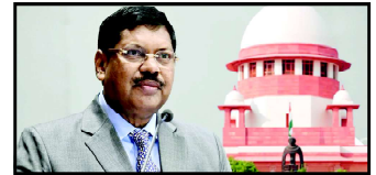
ਚੀਫ ਜਸਟਿਸ ਬੀ.ਆਰ. ਗਵਈ