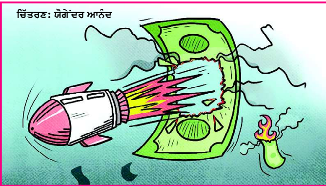
ਚਿੱਤਰਣ: ਯੋਗੇਂਦਰ ਆਨੰਦ

ਇੰਸਟੀਟਿਊਟ ਫ਼ਾਰ ਇਕਨਾਮਿਕਸ ਐਂਡ ਪੀਸ ਦੇ ਅੰਕੜਿਆਂ ਮੁਤਾਬਕ ਪਿਛਲੇ 17 ਸਾਲਾਂ ਵਿੱਚੋਂ 13 ਸਾਲ ਅਜਿਹੇ ਰਹੇ ਹਨ, ਜਿੱਥੇ ਵਿਸ਼ਵ ਅਮਨ ਬੁਰੀ ਤਰ੍ਹਾਂ ਖ਼ਤਮੀ ਹੋਇਆ ਹੈ। 1991 ਵਿੱਚ ਠੰਢੇ ਯੁੱਧ ਦੇ ਖ਼ਤਮ ਹੋਣ ਤੋਂ