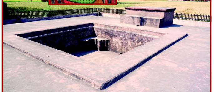
(ਉਪਰ) ਬਾਦਸ਼ਾਹ ਅਕਬਰ ਅਤੇ (ਹੇਠਾਂ) ਉਹ ਬੜਾ, ਜਿਥੇ ਅਕਬਰ ਦੀ ਤਾਜਪੋਸ਼ੀ ਹੋਈ ਸੀ