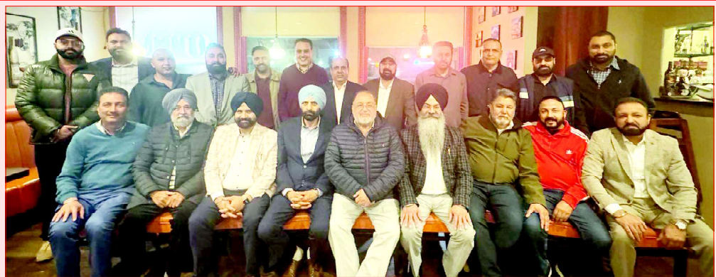
ਬੈਰਿਰਵਿੱਲ (ਇੰਡਿਆਨਾ): ਪੰਜਾਬ ਦੇ ਵਸਨੀਕ ਤੇ ਖਾਸ ਕਰਕੇ ਸਿੱਖ ਸਿੱਧੇ ਵੀ ਜਾਂਦੇ ਹਨ, ਆਪਣੇ ਵਿਰਸੇ ਨੂੰ ਸੰਭਾਲਣ ਲਈ ਅਤੇ ਬਾਬੇ ਨਾਨਕ ਦੇ ਫਲਸਫੇ ਨੂੰ ਸਮਝਣ ਤੇ ਪ੍ਰਚਾਰਨ ਲਈ ਹਮੇਸ਼ਾ ਯਤਨਸ਼ੀਲ ਰਹਿੰਦੇ ਹਨ। ਵਿਦੇਸ਼ਾਂ 'ਚ ਤਕਰੀਬਨ ਹਰ ਸ਼ਹਿਰ ਵਿੱਚ ਬਣੇ ਗੁਰੂਘਰ ਇਸ ਕੰਮ ਵਿੱਚ ਮੋਹਰੀ ਭੂਮਿਕਾ ਨਿਭਾਉਂਦੇ ਹਨ। ਕਈ ਥਾਵਾਂ 'ਤੇ ਅਬਾਦੀ ਅਤੇ ਫਾਸਲੇ ਨੂੰ ਧਿਆਨ ਵਿੱਚ ਰੱਖਦੇ ਹੋਏ ਇੱਕ ਤੋਂ ਵੱਧ ਗੁਰੂਘਰਾਂ ਦੀ ਜ਼ਰੂਰਤ ਵੀ ਪੈਂਦੀ ਹੈ। ਇਸੇ ਲੋੜ ਨੂੰ ਧਿਆਨ ਵਿੱਚ ਰੱਖਦੇ ਹੋਏ ਮਿਲਵਾਕੀ (ਵਿਸਕਾਨਸਿਨ) ਤੋਂ ਕੁਝ ਮੋਹਤਬਰ ਸੱਜਣਾਂ ਨੇ ਗੁਰਦੁਆਰਾ ਕਰਾਊਨ ਪੁਆਇੰਟ ਦੀ ਪ੍ਰਬੰਧਕ ਕਮੇਟੀ ਨਾਲ ਮਿਲ ਕੇ ਤੰਦੂਰ ਰੈਸਟੋਰੈਂਟ ਵਿੱਚ ਫੰਡ ਇਕੱਠਾ ਕਰਨ ਲਈ ਇੱਕ ਮਿਲਣੀ ਕੀਤੀ। ਦਾਨੀ ਸੱਜਣਾਂ ਨੇ ਦਿਲ ਖੋਲ੍ਹ ਕੇ ਸਹਿਯੋਗ ਦਿੱਤਾ। ਇਸ ਮੌਕੇ ਕੁਝ ਬੁਲਾਰਿਆਂ ਨੇ ਸੁਝਾਅ ਵੀ ਦਿੱਤੇ ਜਿਸ ਨਾਲ ਸਾਰਿਆਂ ਨੇ ਸਹਿਮਤੀ ਪ੍ਰਗਟਾਈ।