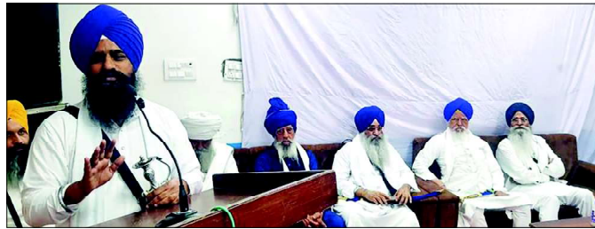
ਉਨ੍ਹਾਂ ਨੇ ਗਲਤੀ ਕੀਤੀ ਹੈ।